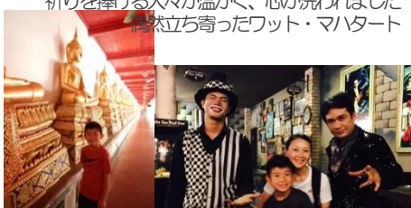
パタヤのマジックショーは突っ込みどころ満載！